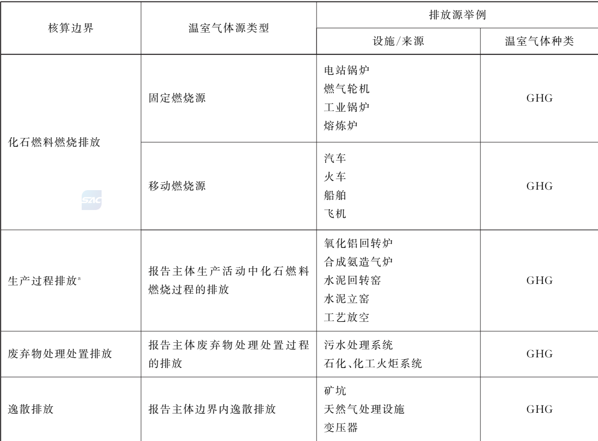
表 1 温室气体源、汇与温室气体种类示意表(包括但不限于)